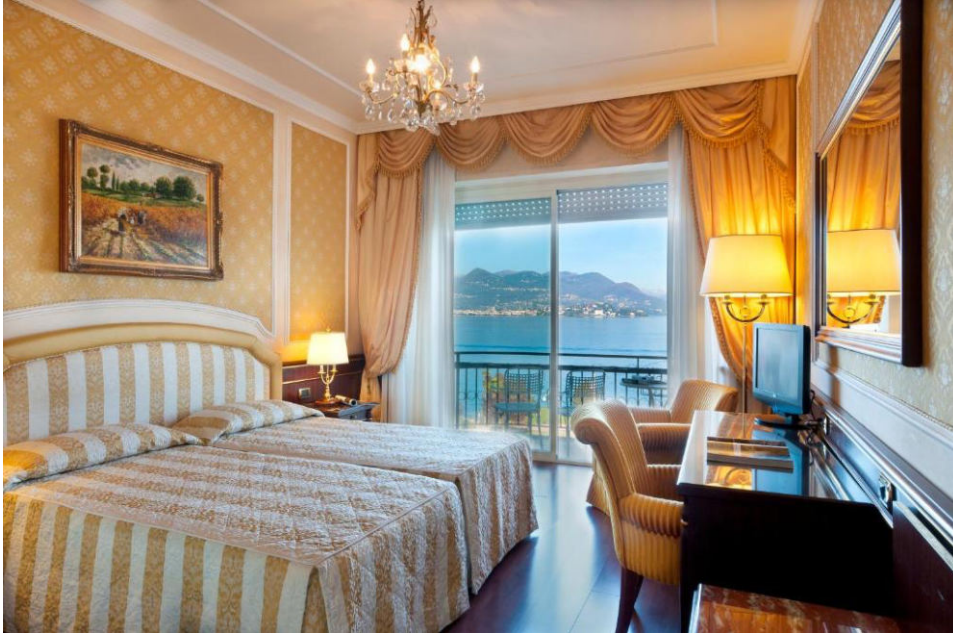
Beispiel Deluxe-Zimmer zur Pool-/Seeseite