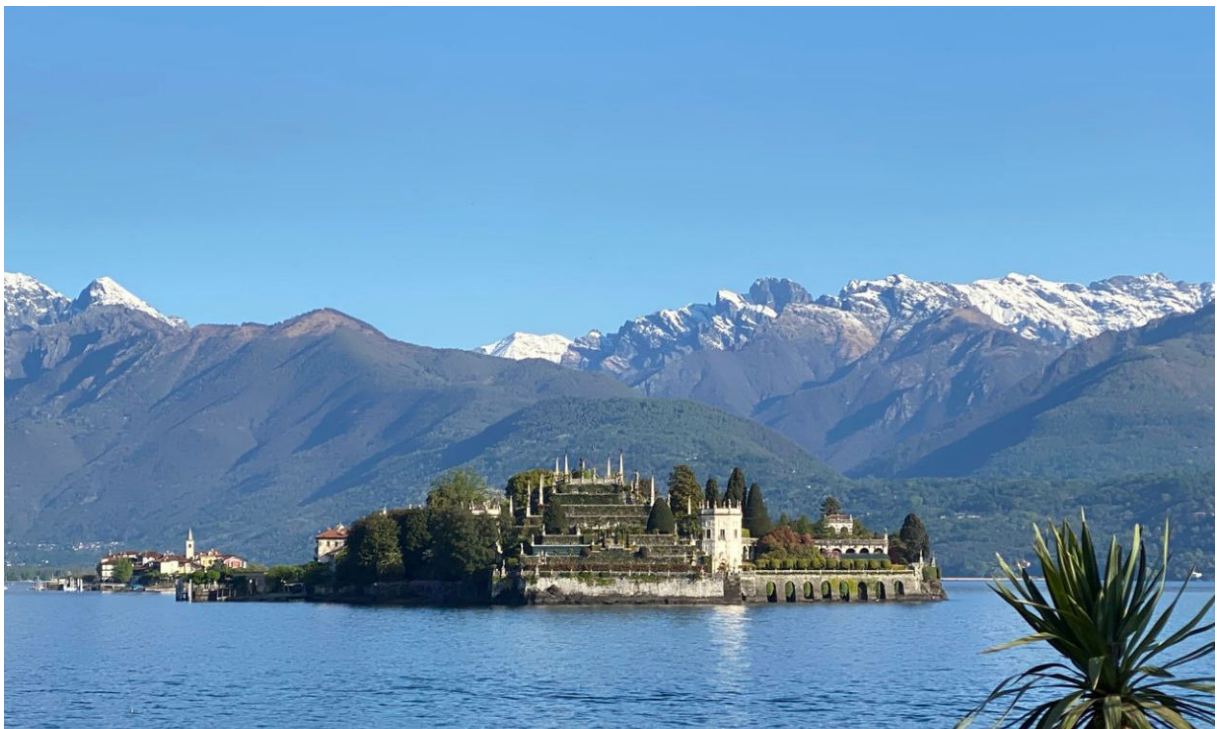
Blick von Stresa auf die Isola Bella