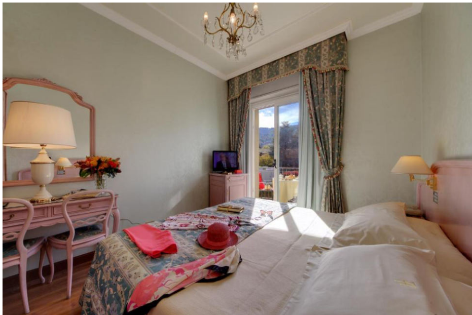
Beispiel Standard-Zimmer zur Bergseite

Das Grand Hotel Bristol empfängt Sie am Fuße der Alpen in einem historischen Gebäude mit Aussicht auf den Lago Maggiore und die Borromäischen Inseln. Freuen Sie sich auch auf einen Panoramapool sowie einen großen, üppigen Garten. Die klassisch dekorierten Zimmer verfügen über ein elegantes Ambiente. Die Wohneinheiten bieten Berg- oder Seeblick. Viele Zimmer umfassen zudem einen eigenen Balkon. Im Hotel erwartet Sie eine Lobby aus Marmor mit Kristallkronleuchtern im böhmischen Stil. Ein Innenpool und eine Fitnessecke gehören zur weiteren Ausstattung. Die Bars laden bei Getränken und Cocktails zum Verweilen ein. Das Zentrum erreichen Sie von der Unterkunft aus nach ca. 800 m.