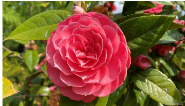
Riesenmagnolie und Camellie aus dem Park der Villa Taranto