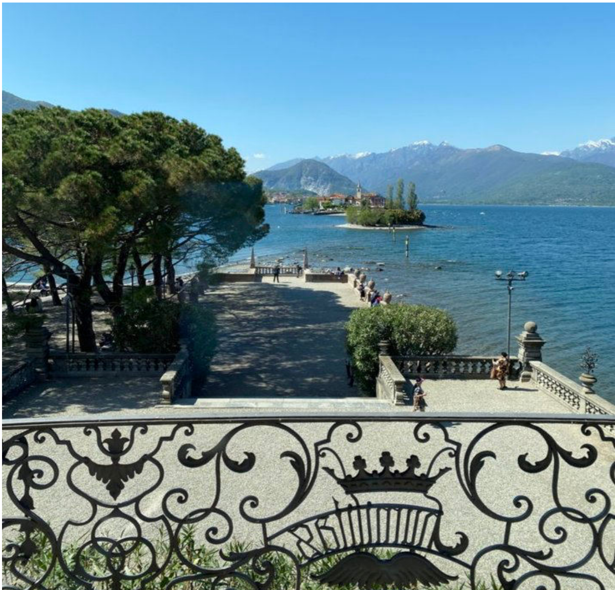
Blick vom Borromäerschloss auf der Isola Bella auf den See

Reisetag 2: Zunächst fahren wir nach Verbania , in die Hauptstadt der Provinz Novara, die vor allem berühmt ist für ihre Parks und Gärten im Vorort Pallanza , in denen Kamelien und Rhododendren ihre bunte Pracht entfalten. Das milde Klima der Region begünstigt den Artenreichtum der heimischen Flora, die besonders anschaulich in den Giardini di Villa Taranto . Dieser Garten beherbergt die größte Pflanzensammlung Italiens mit ca. 20.000 Arten, darunter ein großer Wald mit verschiedenen Magnolien, Kamelien und Hortensien. Wir besuchen diesen Park. Nach dem Mittagessen fahren wir zum Lago d´Orta . Wir fahren nach Orta San Giulio, dem Hauptort des Orta-Sees, einem städtebaulichen Juwel. Oberhalb der Ortschaft befindet sich der Sacro Monte , der zum Welterbe der UNESCO gehört. Ihn umgibt ein Naturreservat mit einem einzigartigen alten Baumbestand.